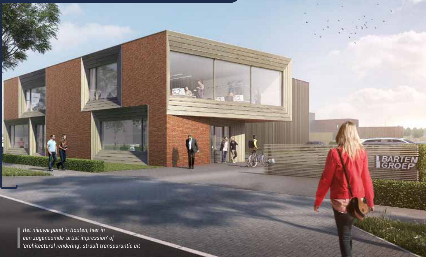
Het nieuwe pand in Houten, hier in een zogenaamde 'artist impression' of 'architectural rendering', straalt transparantie uit

Het nieuwe pand van de Barten Groep is ontworpen door Casper Schuurig en Noor van de Loo van MONK Architecten Utrecht. 'Een gebouw is een ecosysteem,' zeggen ze. 'Het is niet klaar als het er eenmaal staat. Een ecosysteem kan verstoord worden. Dus moet je het beheren en erin blijven investeren.'