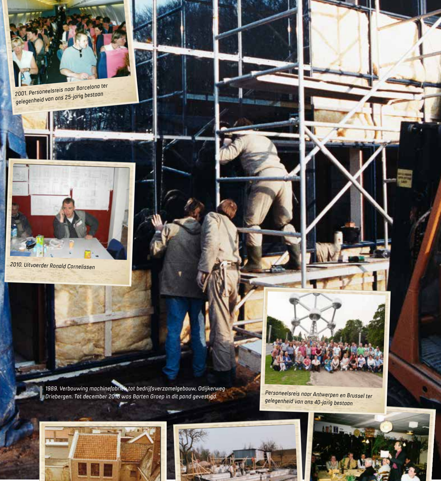
1989. Verbouwing machinefabriek tot bedrijfsverzamelgebouw, Odijkerweg Driebergen. Tot december 2016 was Barten Groep in dit pand gevestigd.