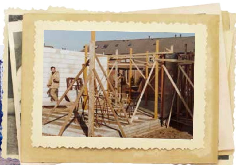
■ 1981. Nieuwbouw woning, Werkhoven