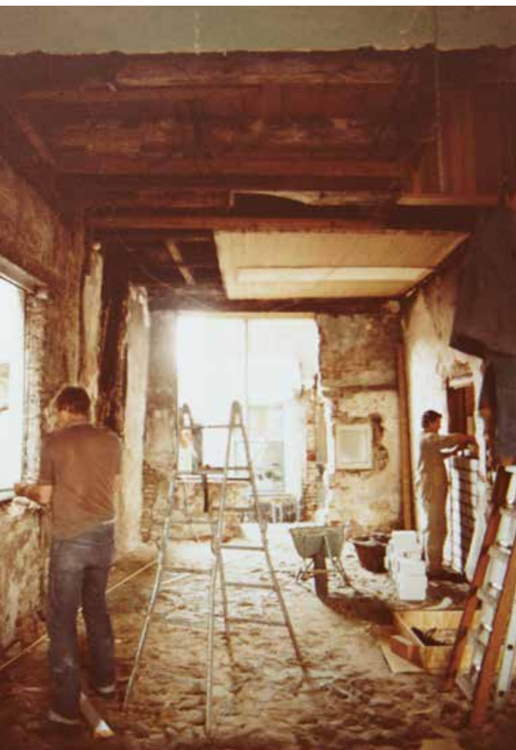
■ 1981. Renovatie Turks restaurant, Tiel

In de veertig jaren dat Barten Groep bestaat zijn er uit de losse pols natuurlijk talrijke 'kiekjes' gemaakt. Van een renovatie, een bouw, een eerste paal, het hoogste punt, van bedrijfsfeesten, afscheidsbijeenkomsten, uitstapjes en personeelsreizen. Op deze pagina's een kleine greep.