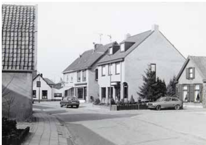
■ 1985-1986. Apotheek met bovenwoning, Odijk