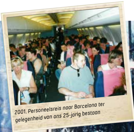
2001. Personeelsreis naar Barcelona ter gelegenheid van ons 25-jarig bestaan