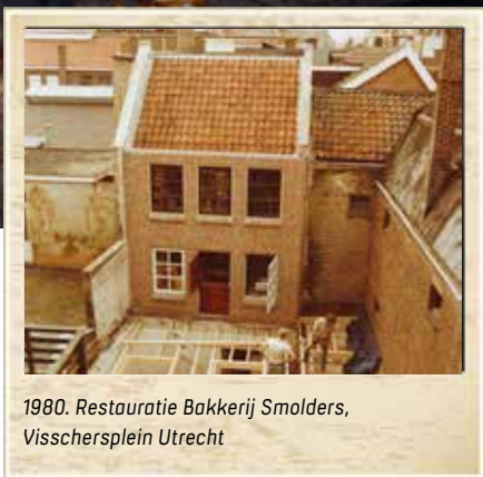
1980. Restauratie Bakkerij Smolders, Visschersplein Utrecht