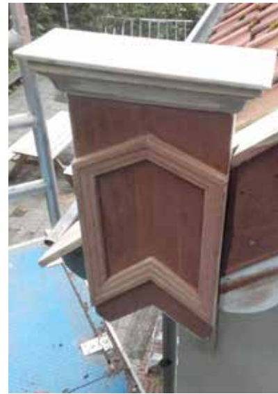
■ Houtrot in Baarn