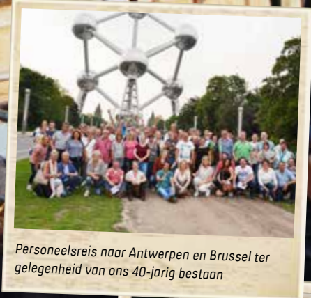
Personeelsreis naar Antwerpen en Brussel ter gelegenheid van ons 40-jarig bestaan