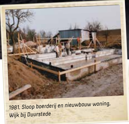
1981. Sloop boerderij en nieuwbouw woning, Wijk bij Duurstede