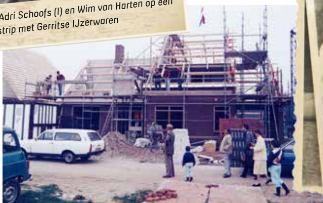
■ 1989. Nieuwbouw woonhuis met aanleunwoning, Odijk